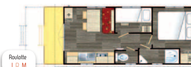
23,20 m 2