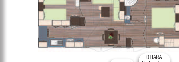
37,24 m 2